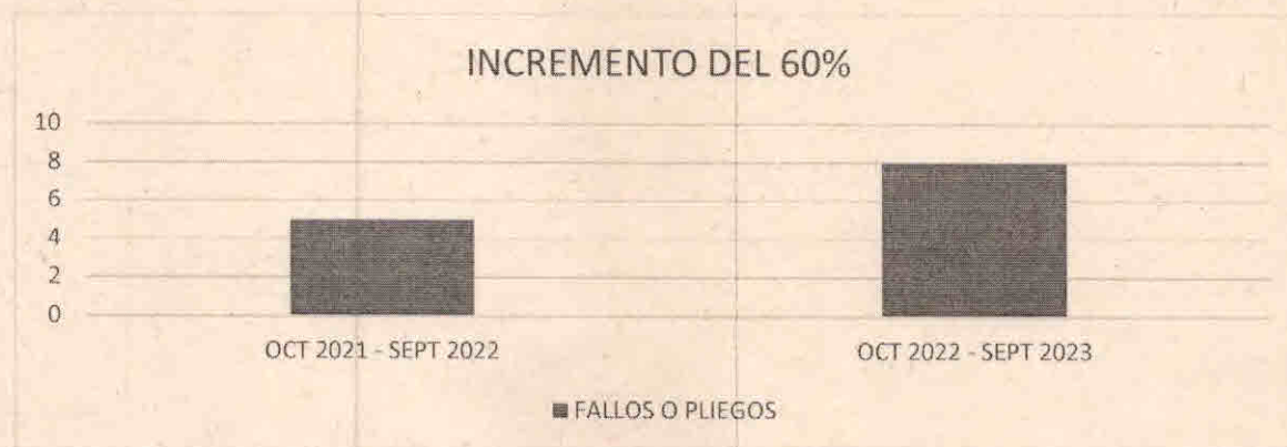
Gráfico # 3

Durante el periodo comprendido entre 01 de octubre del 2022 al 30 de septiembre del 2023, la Oficina de Control Interno Disciplinario tomó ciento tres (103) decisiones finales, las cuales corresponden a seis (6) pliegos de cargos, y dos (2) fallos sancionatorios; lo que indica a un incremento del 60% frente al año anterior; además, para el periodo en mención, fueron expedidos noventa y cinco (95) autos de archivo, lo que indica una disminución del 42% con relación al año anterior, detallados así: