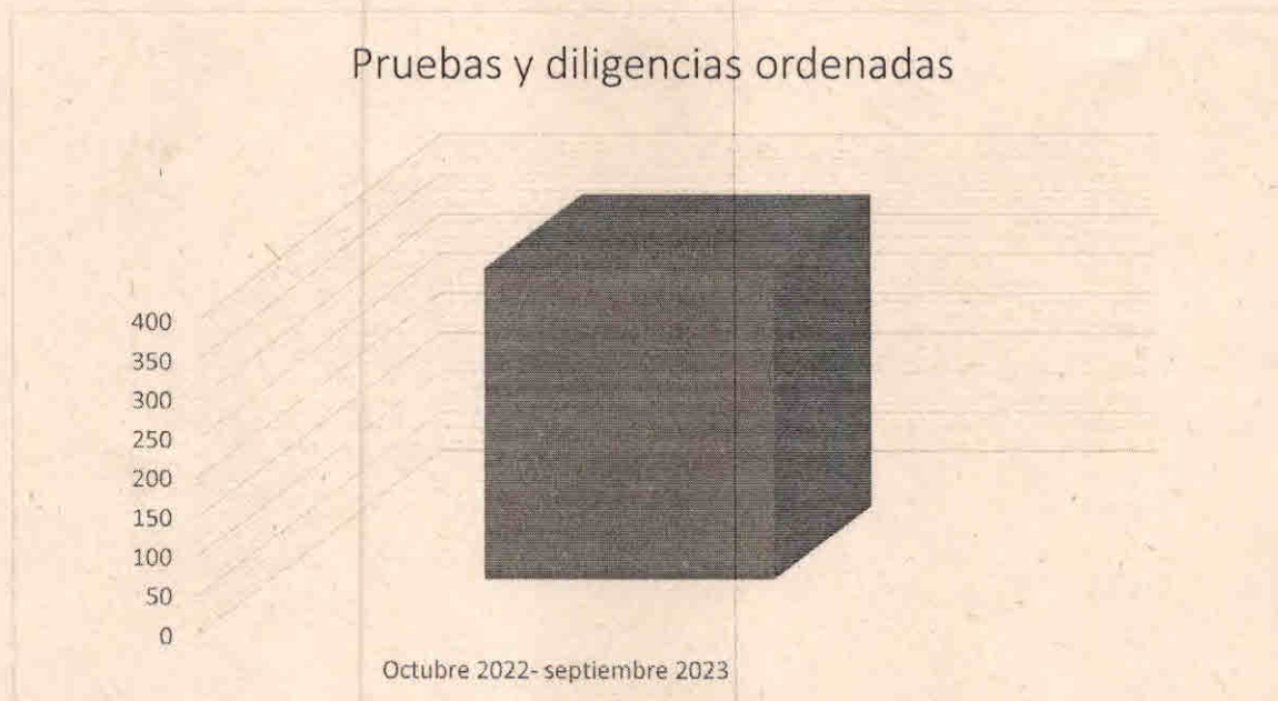
Gráfico # 2

Además, esta Oficina ordenó trecientas noventa y seis (396) pruebas y diligencias.