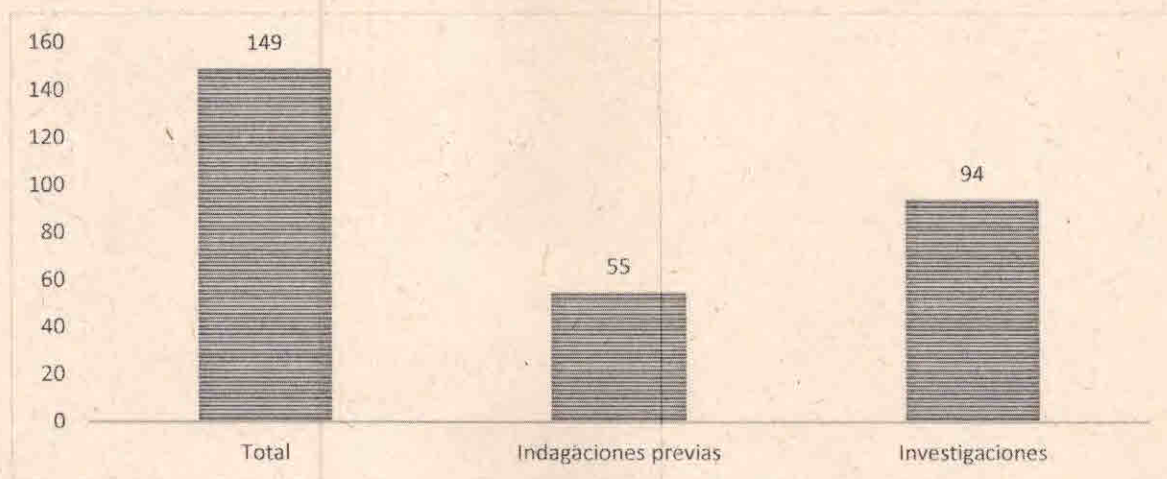
Gráfico # 5

La Oficina de Control Interno Disciplinario, a corte 30 de septiembre de 2023, cuenta con ciento cuarenta y nueve (149) actuaciones disciplinarias activas, de las cuales cincuenta y cinco (55) corresponden a indagaciones previas y noventa y cuatro (94) a investigaciones disciplinarias. Tal como se indica en el siguiente gráfico: